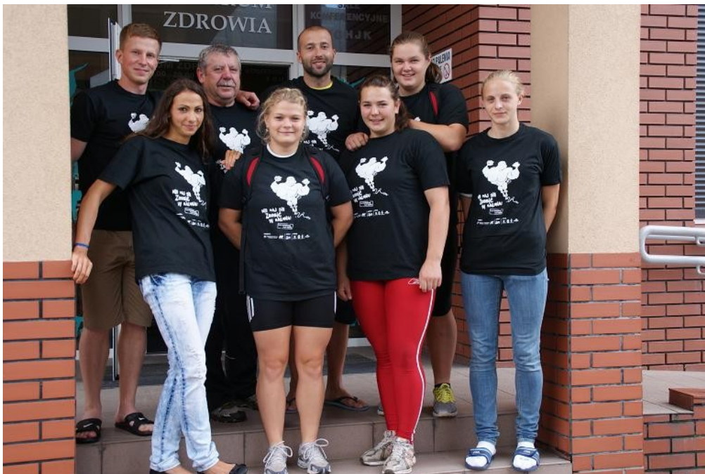
Mistrzostwa Polski Juniorów w Pływaniu, 15 lipca 2011 r., Ostrowiec Świętokrzyski