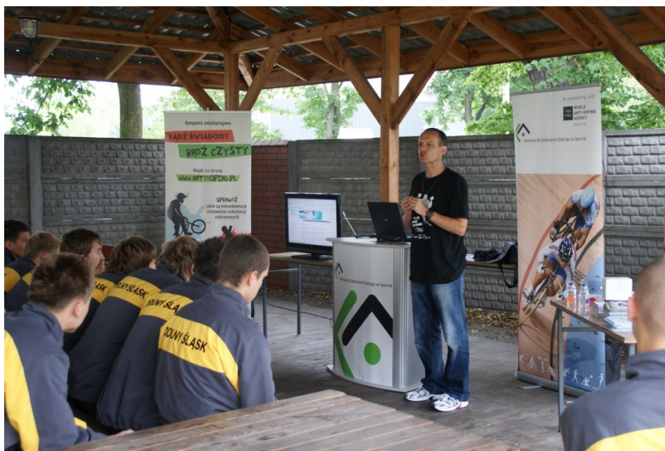
Ogólnopolska Olimpiada Młodzieży, 9 lipca 2011 r., Tenis ziemny, Warszawa